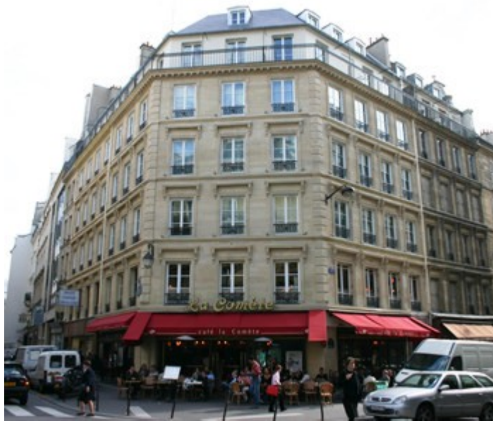
la façade haussmanienne classique