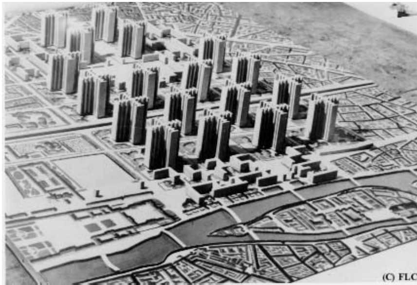
Cité jardin (1925, projet)