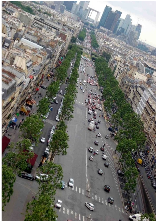
Avenue de la Grande armée

Entre 1853 et 1870 : 20 000 bâtiments sont rasés et 43 000 sont construits. Des espaces verts sont insérés. Des centaines d'ingénieurs sont mobilisés : hydrologues, géologues... On a d'abord éventré les foyers d'insécurité et d'épidémie.