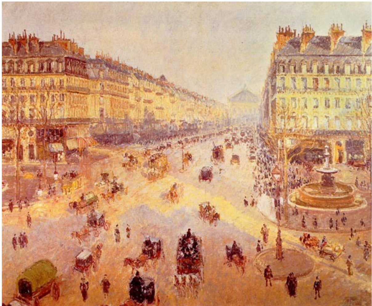
Avenue de l'Opéra par Pissaro